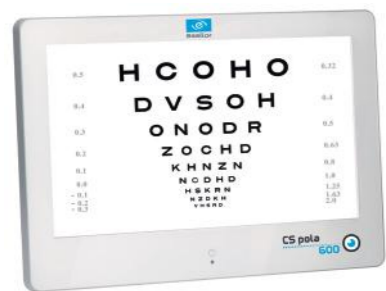
CS POLA 600